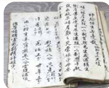
祖父留傳下來的手抄本藥方，使許多人脫離痛苦。