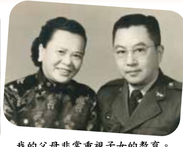
我的父母非常重視子女的教育。