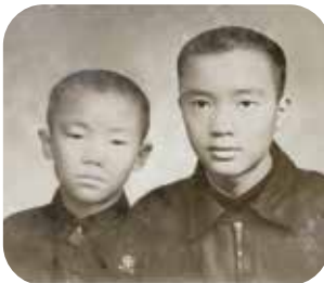
哥哥(右)是我心目中的英雄。

很感興趣，為了收集圖片，我曾去到他們的兒童主日學。我還記得那位胖胖的宣教士講故事的神情，她舉起手中的圖片，用她外國口音的山東腔，對我們說：